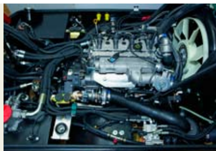
Двигатель с низким уровнем выбросов

Аксиально-поршневой насос переменного рабочего объема для привода вентилятора и оборудования. Сдвоенный шестеренчатый насос на систему рулевого управления, для вспомогательных функций и для привода боковых и передней щетки.