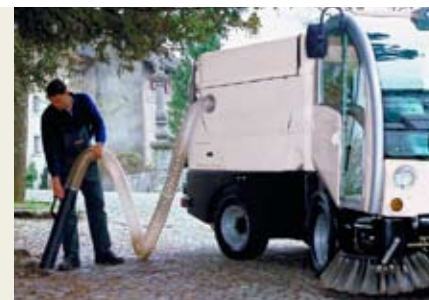
Боковой всасывающий рукав

Агрессивная щетка – безопасный способ удаления травы механическим способом без применения химических реагентов.